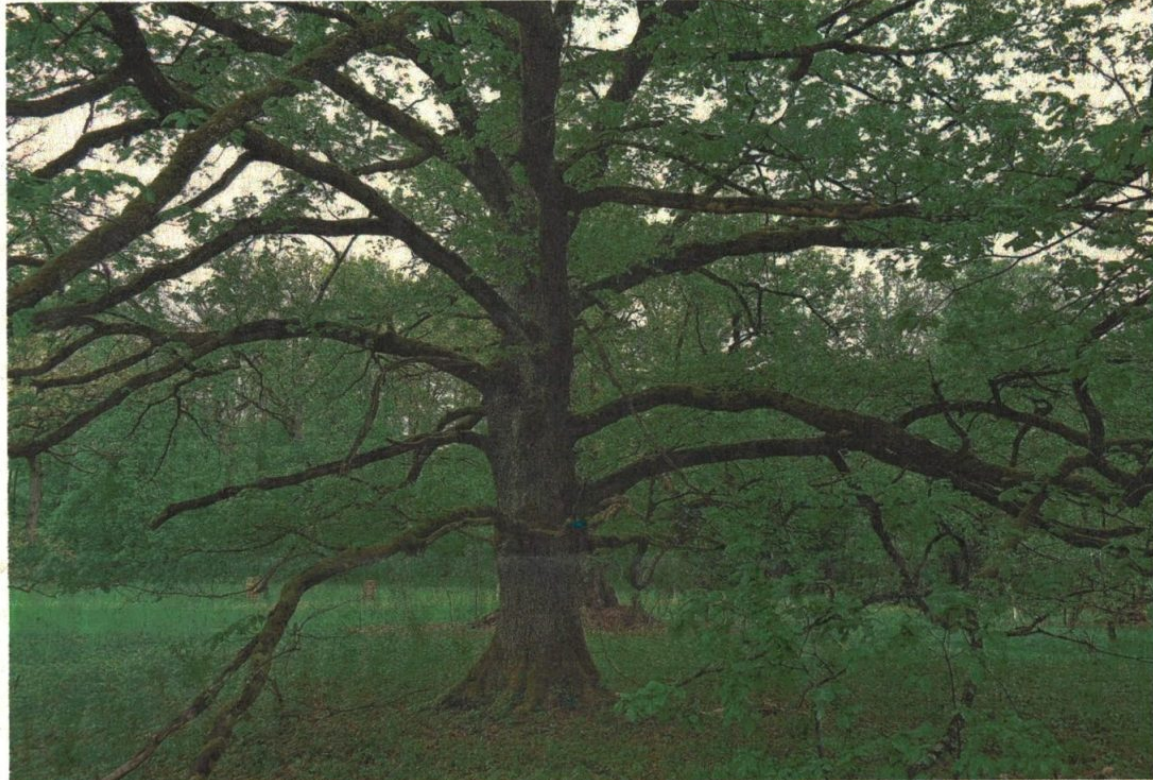
Eine mächtige noch junge oder mittelalte Wildensteiner Eiche.