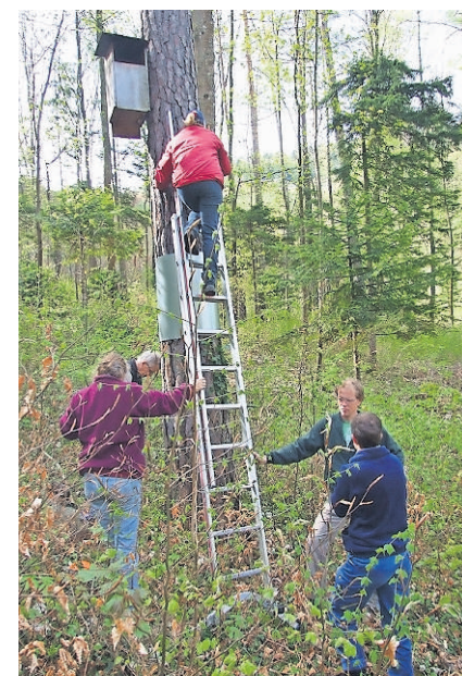
Kontrolle eines Eulenkastens.