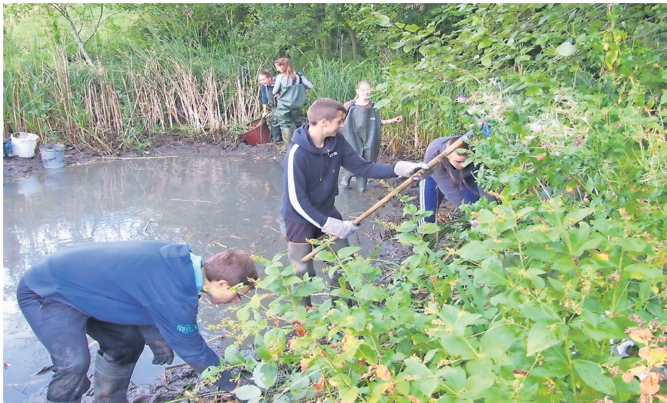
Eine Schulklasse hilft bei einem Pflegeeinsatz am Rüttmattweiher.

1931 wurde der Verein auf Obstbau- und Vogelschutzverein umbenannt. 1978 nahm ein junger, neuer Vorstand die Zügel in die Hand mit dem Ziel, einen neuzeitlichen, ganzheitlichen Naturschutz zu betreiben. Es wurden nun unter dem Namen Natur- und Vogelschutzverein diverse Projekte gestartet. So legte man in der ehemaligen Griengrube am Dielenberg eine Magerwiese an, es wurden mehrere Hecken gepflanzt, die Weiheranlage in der Rüttmatt gebaut, die Revitalisierung der Frenke und die Solaranlage auf der Mehrzweckhalle initiiert. Selbstverständlich ist der NVO auch bei der Neophytenbekämpfung und am jährlichen Naturschutztag aktiv dabei. Im Bereich Artenschutz laufen Projekte für den Wiedehopf, die Eulen, Schwalben und Spyrn. Eine grosse Arbeit jeden Frühling ist auch die Rettung der Amphibien bei der Überquerung der Bennwilstrasse, damit sie nicht von Autos überfahren werden. Es werden Kurse, Vorträge und Exkursionen zu verschiedensten Themen durchgeführt. Bei umweltrelevanten Abstimmungen meldet sich der Verein auch politisch zu Wort, so beispielsweise 2013 für die Revision des